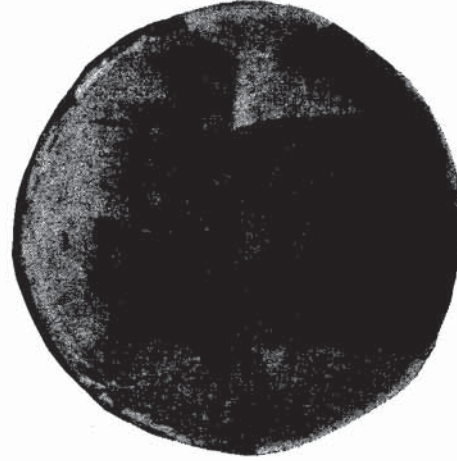
Res. 9 — Van kalesi II no'lu sondajdan: "Samani" sonrası? bir kâse.