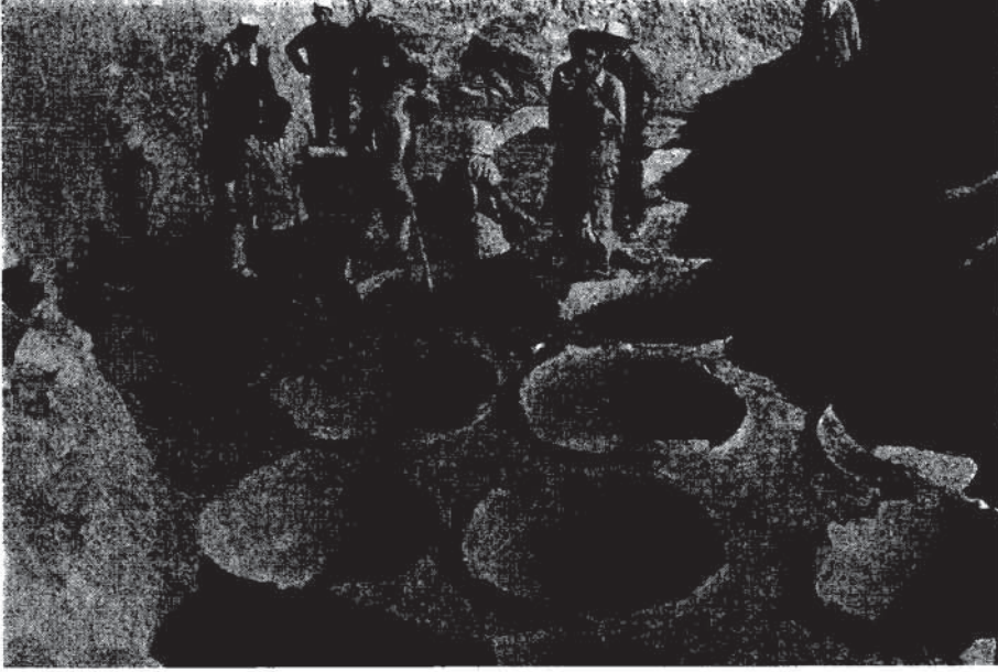
Res. 3 — “Pithoslu Mekân” (kuzeyden).