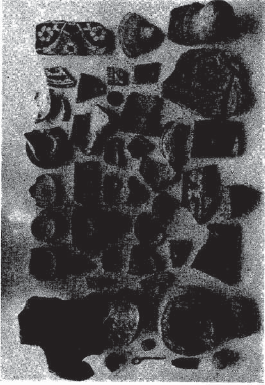
Res. 7 — Van kalesi I ve II No'lu sondajdan: Osmanlı-Selçuk buluntuları.