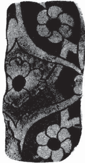
Res. 8 — Van kalesi II no'lu sondajdan: Osmanlı devri (16yy-17yy. 1. çeyreği). çinisi