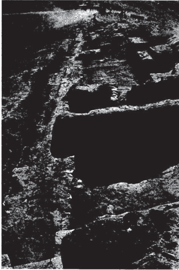
Res. 2 — “Uç kale” önündeki ikinci ve üçüncü iskân evlerine ait yapı kalıntıları (batıdan).