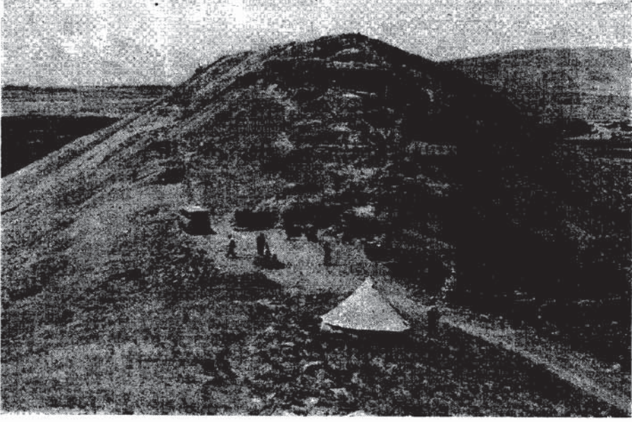
Res. 1 — Çavuştepe “Uç kale” ile “Çifte Rampalar” arasındaki iskân alanı “İstinatlı Yollar” (Doğudan).