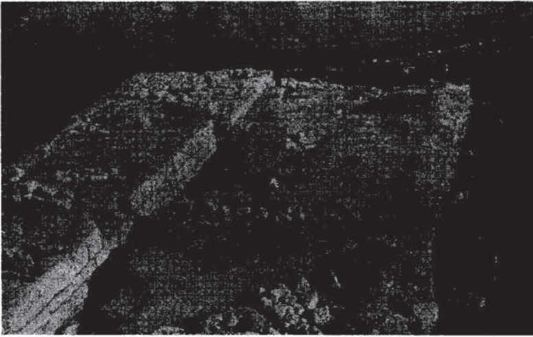
Res. 4 — “Madır burç” genel görünüş (güneyden)