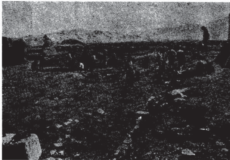
Res. 5 — Van kalesi, I No'lu sondaj alanından genel görünüş.